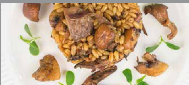
Houbový kuba (4 porce)

Pokud v kuchyni rádi experimentujete a hledáte zdravější varianty tradičních jídel, uvařte si podle receptu restaurace Maranatha výtečného houbového kuby, který kombinuje žampiony a lesní houby s Jidášovým uchem. Namísto klasických krup použijte kamut, prastarý druh pšenice, který se vyznačuje vysokým obsahem selenu, nenasyčených mastných kyselín, zinku a hořčičku.