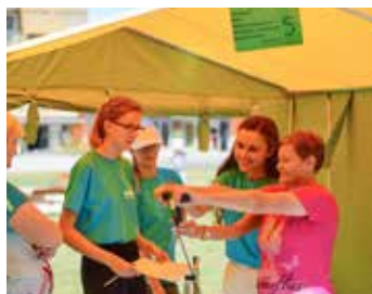
△ Akce Mladí pro Ježíše

Podstatnou je pro Maranathu i zdravotní osvěta napomáhající lidem vést zdravější, a tudíž i plnohodnotnější život. Proto už řadu let provozuje stejnojmennou vegetariánskou restauraci a obchod se zdravou výživou v budově BRUMLOVKA.