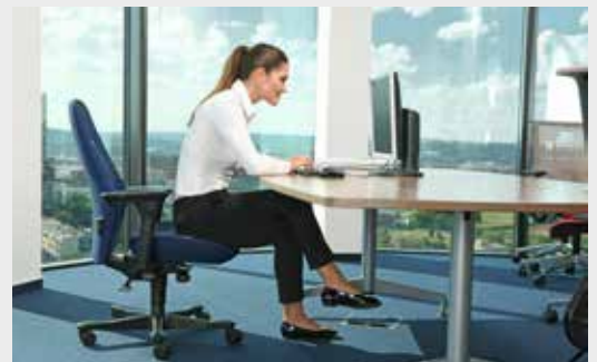
Příklad špatného sezení

Důležitá je také správná velikost myši. Platí, že čím subtilnější dlaň, tím menší by měla být i myš. Proto vždy volte myš, která bude odpovídat velikosti vaší dlaně. Při výběru se řiďte pravidlem, že myš by měla být v ruce přirozeně. Ideální také bude, když použijete ergonomickou gelovou podložku pod myš, která eliminuje negativní vlivy při dlouhodobé práci s počítačem. Naučte se také používat myš oběma rukama. Chce to trénink, ale ulevíte přetěžování jednoho zápěstí.