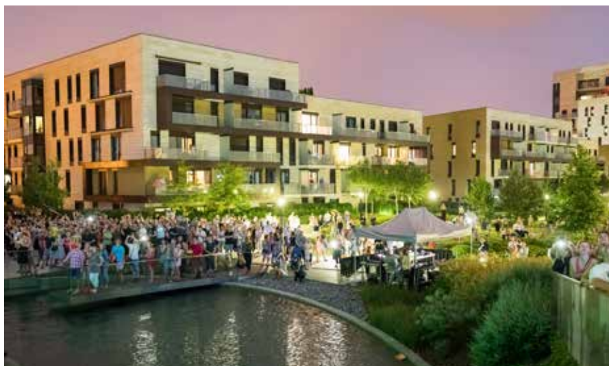
◀ Diváci se zatajeným dechem sledují vystoupení provazochodce