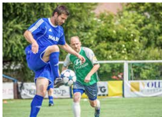
◁ Hrál se akční, opravdový a přátelský fotbal