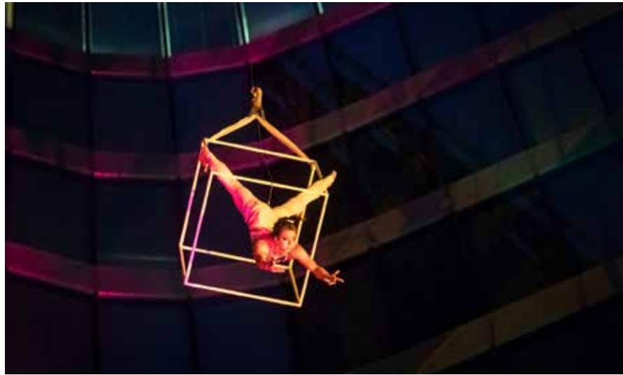
◀ Taneční vystoupení ve výšce 50 metrů bylo jedním z vrcholů oslav

Program na pódium provázela řada aktivit pro děti i dospělé, jako malování na obličeje či soutěže. Nechyběly ani stánky s občerstvením.