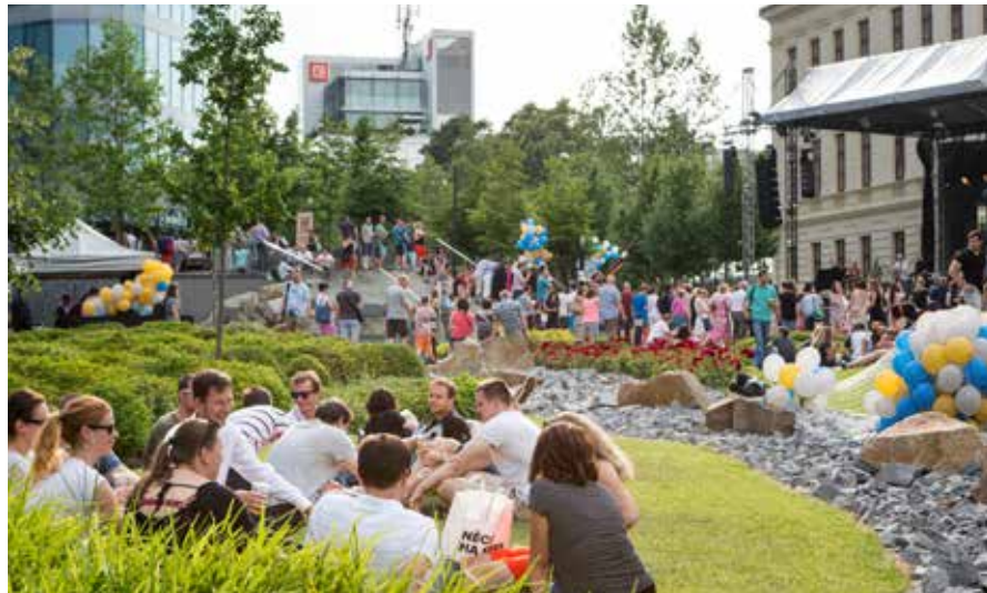
◀ Počasí se opravdu vydařilo