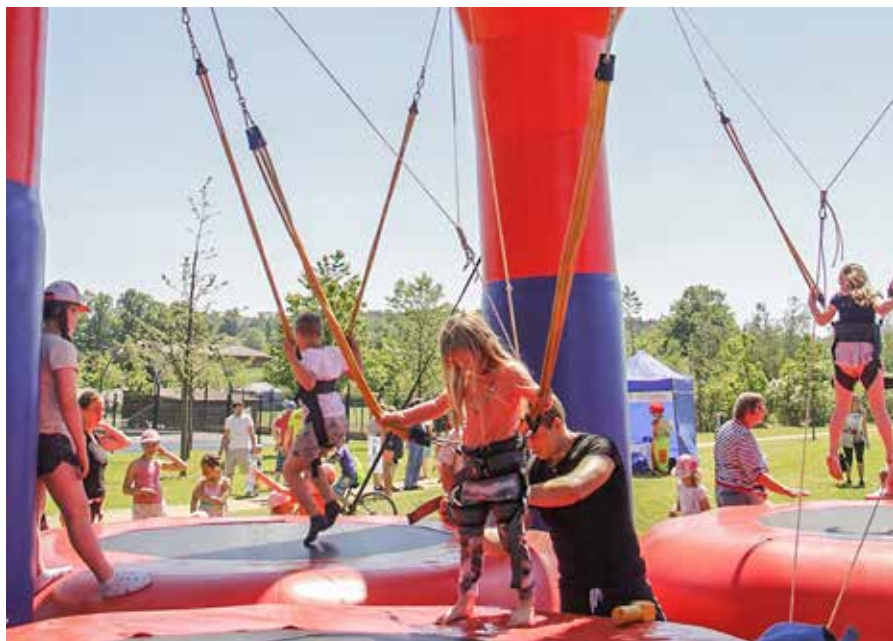
△ Dětský sportovní den ve Štětkovících

Za 15 let se také podařilo založit několik křesťanských sborů. Za zmínku jistě stojí Společenské centrum BETHANY, které vzniklo zde v BB Centru. Každou sobotu se tady konají bohoslužby, budova slouží navíc i jako společenské centrum. Další sbory vznikly ve Štětkovících a v Sedlčanech. Nejnověji Maranatha podporuje založení sboru v Bratislavě. Velké požehnání přináší také Křesťanská střední škola, základní škola a mateřská škola Elijáš. Tyto vzdělávací instituce vznikly jako součást BB Centra a těší se velkému zájmu rodičů i dětí. Vždyť rodina je další stěžejní téma, kterým se Maranatha zabývá. Pro malé i velké například pořádá každoroční dětský den na Sedlčansku.