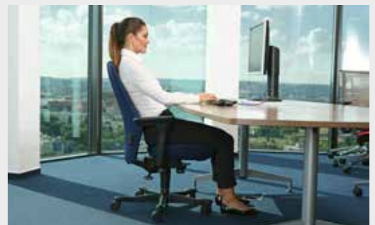
Příklad správného sezení