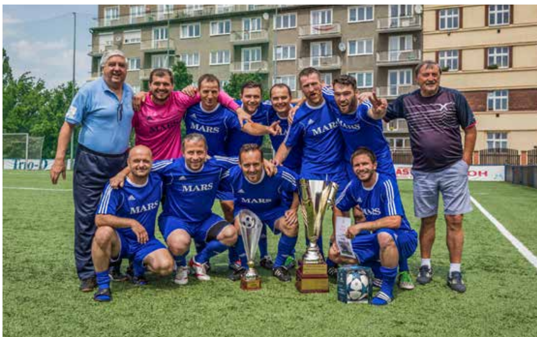
◁ Vítězný tým společností MARS s pohárem a legendami fotbalu Karolem Dobiašem a Antonínem Panenkou